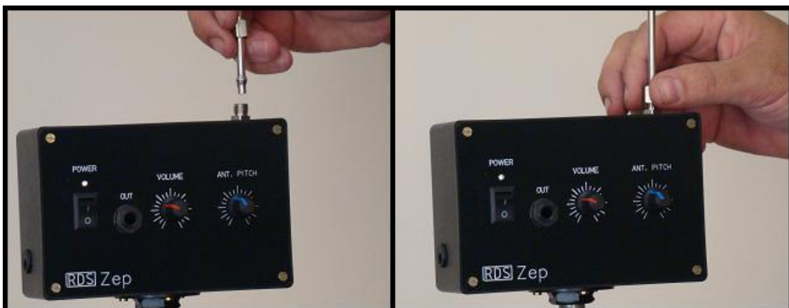
Fig.2 - Instalando a antena de Tom.Verifique antes de apertar se esta corretamente na vertical.

Antes de ligar seu RDS Zep será necessário instalar a antena. Encaixe-a no lugar e aperte a porca da levemente, até que ela fique firme e alinhada(Figura 2).