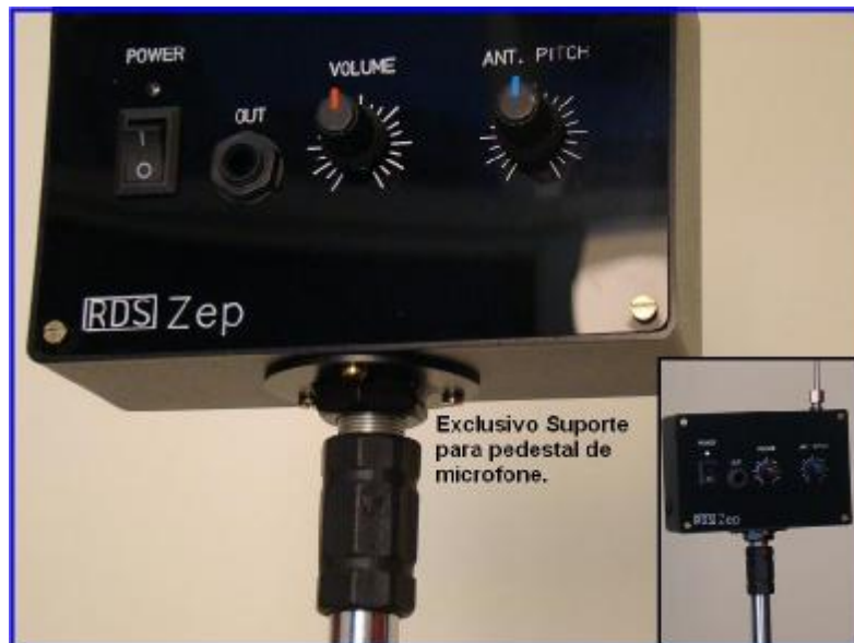
Exemplo do RDS Zep no pedestal de microfone.

Na parte inferior do Theremin existe um Suporte para utilizá-lo num pedestal tipo microfone. Pode ser do tipo girafa ou reto.